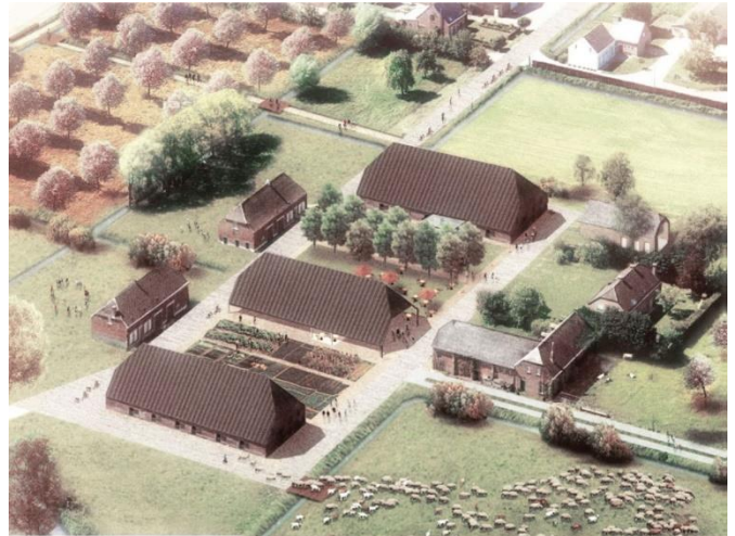
Visualisatie toekomstscenario Prosperhoeve ©Studiobureau OMGEVING

De Prosperhoeve werd opgetrokken om de exploitatie van de omliggende gronden aan te sturen. Oorspronkelijk stonden er drie schuren. Vandaag is de Vollemanshuur de enige originele schuur die nog overeind staat. Ze is in slechte staat en heeft geen functie meer. We restaureren de buitenschil en richten de binnenkant in met onthaal en horeca. Bij de uitwerking besteden we aandacht aan ontmoeting, informatie, spelprikkel en toegankelijkheid, met behoud van de eigenheid van de schuur. In een expositieruimte kan de bezoeker meer leren over het landbouwverleden van deze plek en de omliggende natuurgebieden. Daarnaast zal het centrale middenplein dienen als terraszone, ingericht met speelelementen en twee historische bomenrijen.